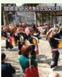
関鶏楽(下呂市無形民俗文化財)